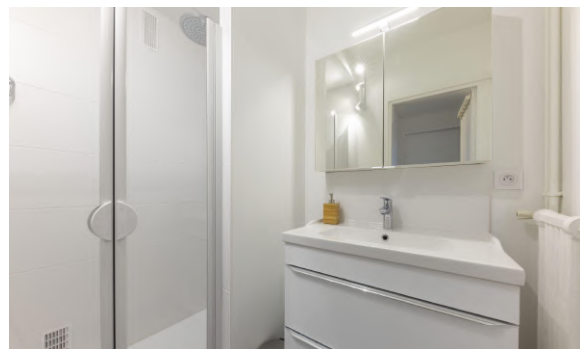
salle de bain