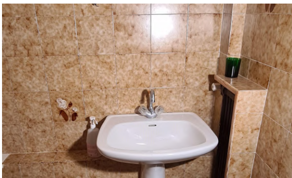
salle de bain